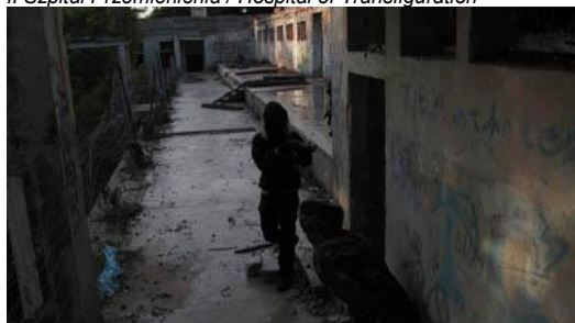
III. Dziedziniec Obląkanych / Courtyard of the Insane (I killed your boyfriend).