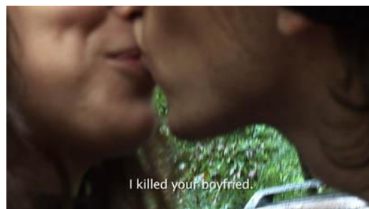
III. Dziedziniec Obląkanych / Courtyard of the Insane (I killed your boyfriend).